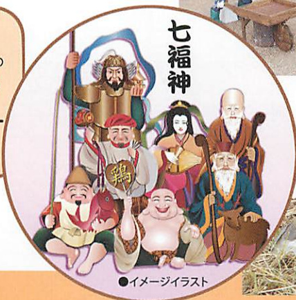
●イメージイラスト